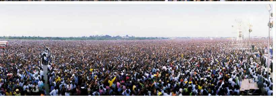
1.6 ՄԻԼԻՈՆ ՄԱՐԴ՝ ՆԵՐԿԱ ՄԵԿ ԾԱՌԱՅՈՒԹՅԱՆ ԼԱԳՈՍՈՒՄ՝ ՆԻԳԵՐԻԱՅՈՒՄ, 2000