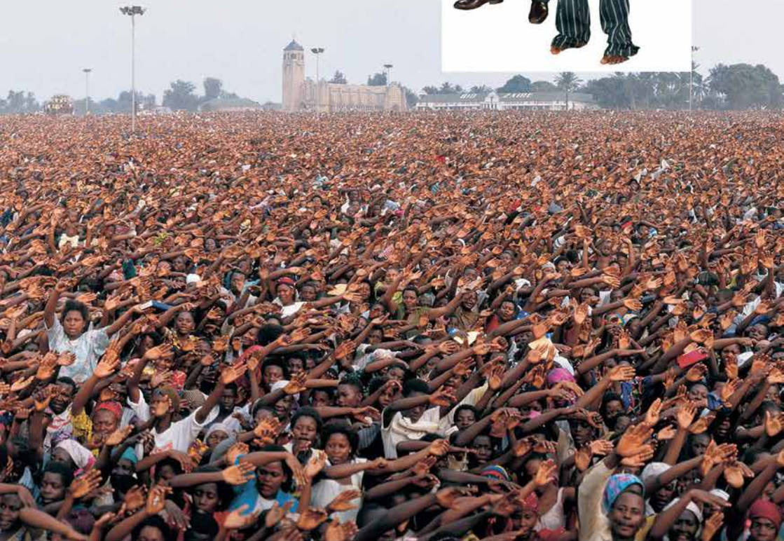
ԱԿԵՏԱՐԱՆԻ ՀԱՄԱՐ ՄԵՇ ԶԱՐՑ ՈՒՆԵՑՈՂ ՄԱՐԴԻԿ, ՄԲՈՒԶԻ-ՄԱՅԻ, 1991