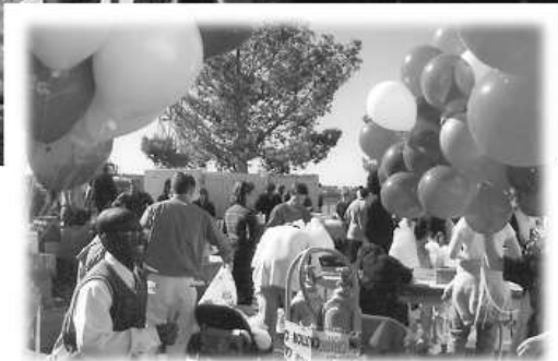
«Սեր» նախագիծը՝ Գոհուբյան և Սուրբ ծննդյան տոների ժամանակ, Սան Դիեգոյում կերակրում է ավելի քան 1.000 մարդու: