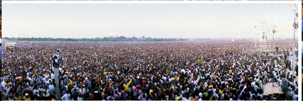
1.6 ՄԻԼԻՈՆ ՍԱՐԴ՝ ՆԵՐԿԱՅ ՄԷԿ ԾԱՌԱՅՈՒԹԵԱՆ ՆԻՃԵՐԻՈՅ ԼԱԿՈՍ ԶԱՂԱՔԻ ՄԷՋ, 2000