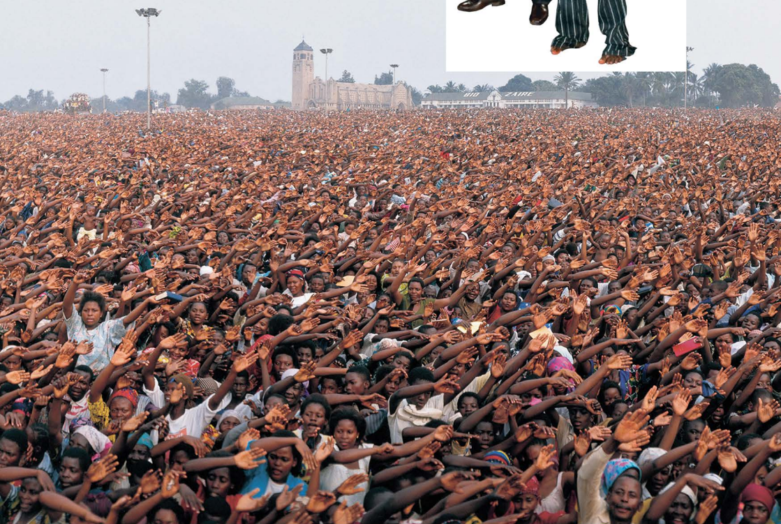
ԱԽԵՏԱՐԱՆԻ ՀԱՄԱՐ ՄԵԾ ԺԱՐՑ ՈՒՆԵՑՈՂ ՄԱՐԴԻԿ, ՄՊՈՒԺԻ-ՄԱՅԻ, 1991